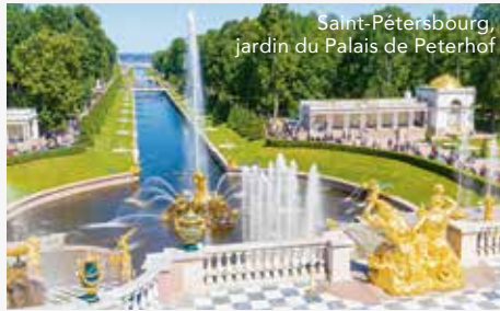
Saint-Petersbourg, jardin du Palais de Peterhof