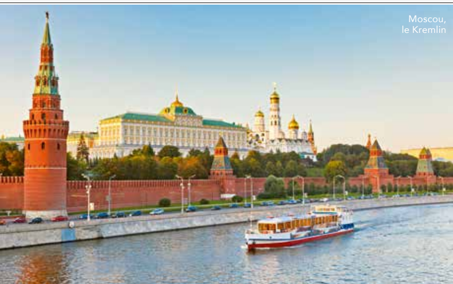
Moscou, le Kremlin